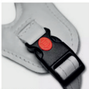
fermeture avec verrouillage