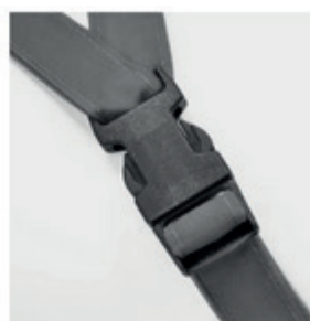
Fermeture fixlock (option)