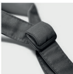
Fermeture boucle standard