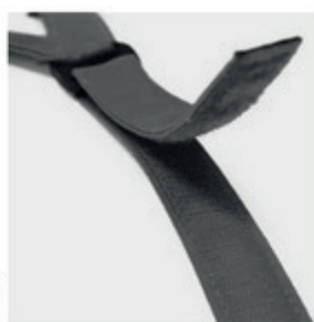
Fermeture velcro (option)