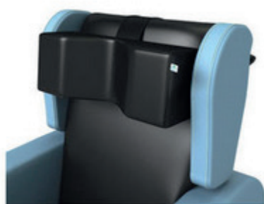
Appui de tête courbé