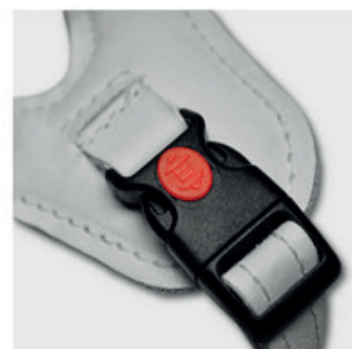
fixlock avec Verouillage (option)