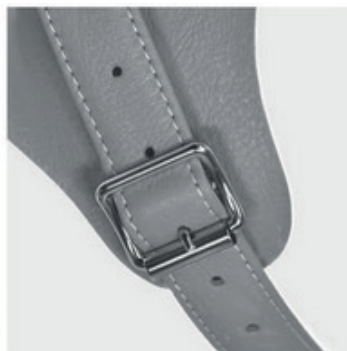
Boucle renforcée (option)