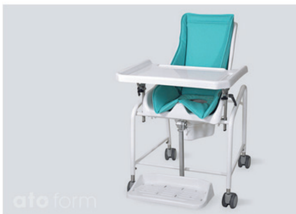
Plateau support pieds-tablette -capitonna néoprène