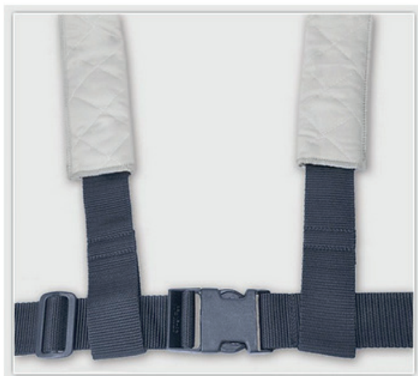
Sangle pelvienne-Sangle thoracique- harnais