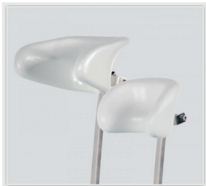
Appui de tête et support coup